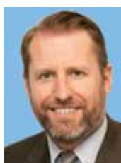
Guillaume des Seynes Président La Montre Hermès www.hermes.com